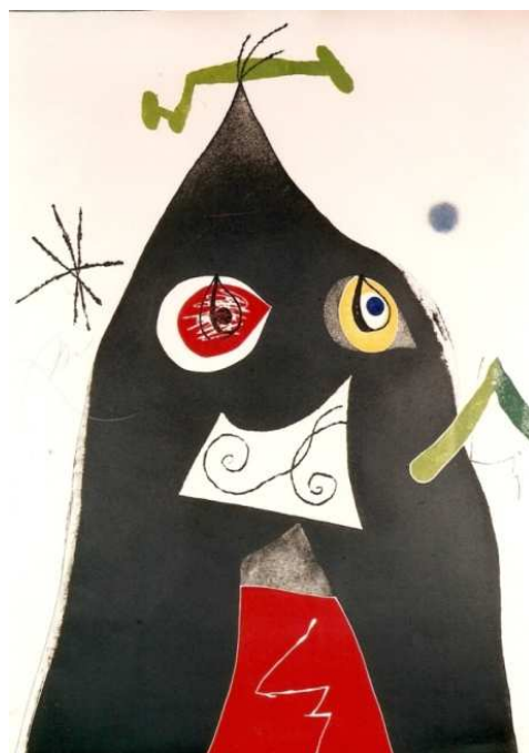
Fig. 1 Quatre estampes de Joan Miró. Quatre colors apareien al món...