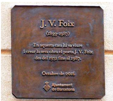
Placa al carrer Setantí al barri de Sarrià de Barcelona, lloc on Foix rebia al menjador de casa seva admiradors, estudiants, familiars i amics per mantenir-hi tertúlies.

arriscar el meu modest parer si algú me'l demanava. Per distingit que fos el convidat, es feia silenci quan Foix prenia la paraula. Jo no recordo un causeur més exquisit, més divers, més intel·ligent en troballes de tota mena. Amb un art invisible i discret, solia dirigir el seu discurs cap a l'abstracció més alta, sense refusar de collir pel camí totes les flors que la seva rica fantasia li oferia. Amb paraules vives, precises, exactes i lluminoses, en frases clares com el cristall, però alhora amb veu rotunda i sense fatiga, desenvolupava les seves nobles paradoxes. Foix proposava una estranya saviesa, una filosofia elegant, en axiomes imprevistos. La seva eloqüència sorprenia sobretot per la claredat. No hi havia en el seu parlar ni rastre de la prosa pedantesca i avorrida que gasten els professionals del milieu , i que pot desconcertar un públic no iniciat. Res d'això no hi havia en la conversa de Foix. Res de més net, de més directe, que el seu discurs, no en va era un