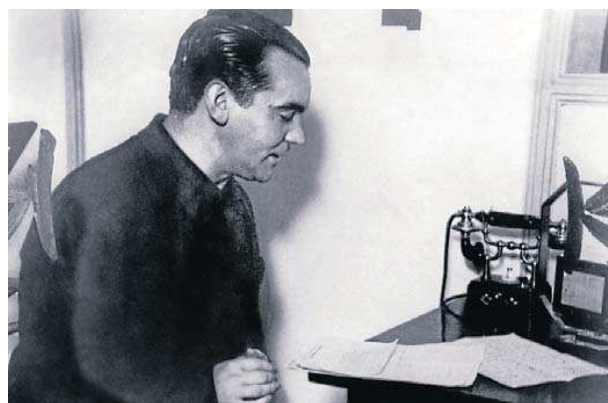
Federico García Lorca en una audició a Radio Stentor durant la seva estada a Buenos Aires l'octubre del 1933.