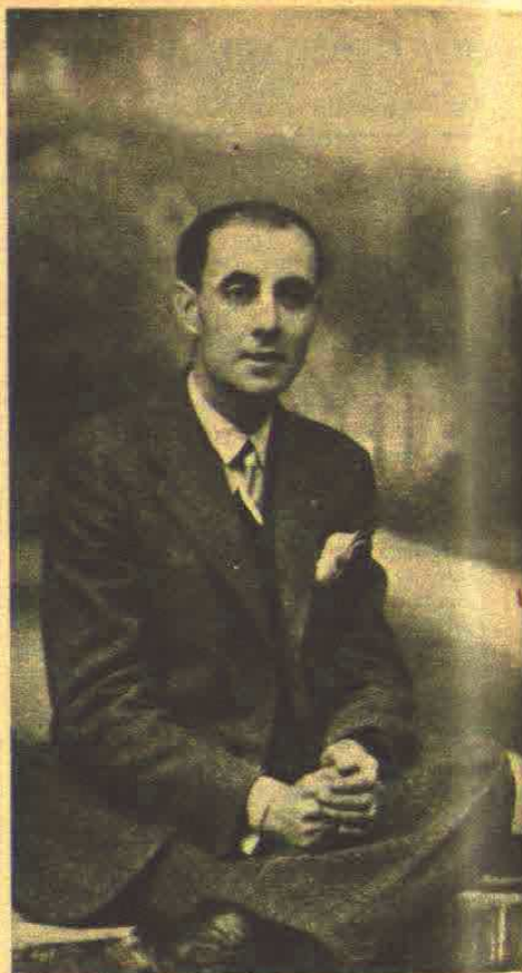
El poeta, en 1942.

Hay grandes poetas a los que uno se permite el lujo de admirar desinteresadamente, sin pensar para nada en la propia obra. Pero a mí me ocurre con Foix que no puedo leer un poema suyo sin pensar en seguida cuánto me hubiera gustado hacer algo por el estilo y sin preguntarme cómo podría hacer para hacerlo. Foix me estimula porque le envidio. Acaso sea ésa la secreta razón —la envidia, en dosis fuertes, acaba